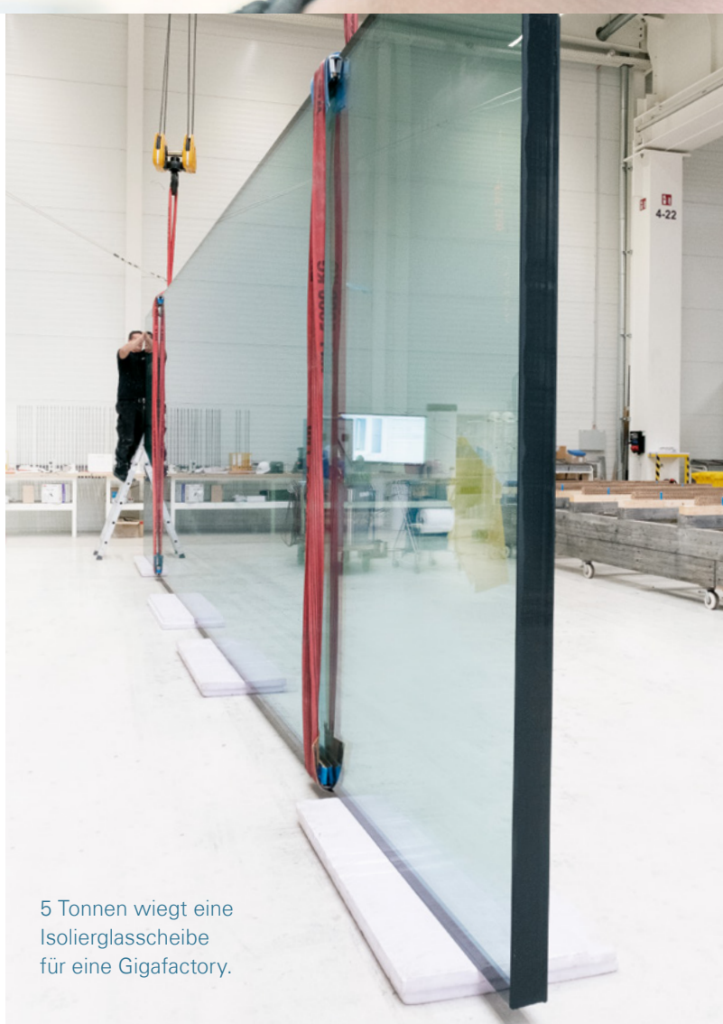
5 Tonnen wiegt eine Isolierglasscheibe für eine Gigafactory.

Groß, größer, sedak Bei uns dreht sich alles um die Bearbeitung und Veredelung von Glas bis zu 20m Länge. Wir bearbeiten Gläser so, dass sie vielseitig einsetzbar sind. Dazu gehört zum Beispiel das Bedrucken, Biegen oder die Herstellung von Sicherheits- und Isolierglas im XXL-Format in höchster Qualität. Das braucht Fachleute, die wir ausbilden.